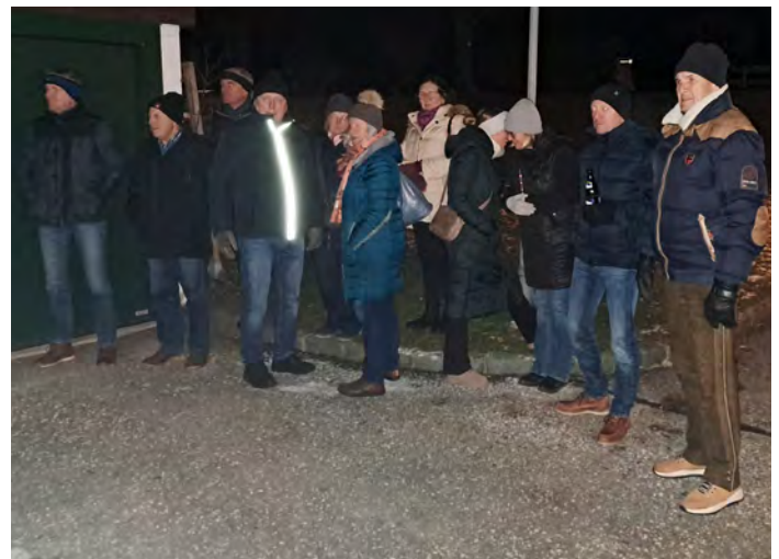
Familie, Freunde und Nachbarn gratulieren dem Jubilar