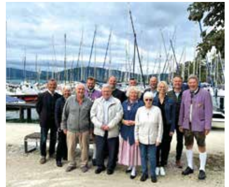
Foto: Unsere Gäste aus Wanfried und die Schörflinger Abordnung