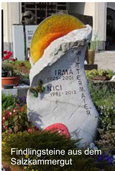
Findlingsteine aus dem Salzkammergut

stoneart.at KUNST-STEINMETZ POINTNER Ges.m.b.H. Gmundnerstr.24, 4861 Schörfling Tel. 0699/11111422, 0660/4080289