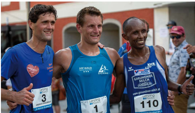
Foto: Die Erstplatzierten des 19. Sickinger-Rundlaufs 2021